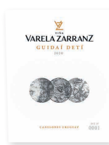
96 VIÑA VARELA ZARRANZ Guidaí Deté 2023 Tannat, Marselan, Cabernet Franc CANELONES