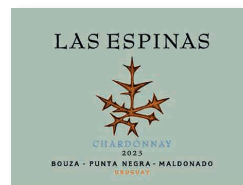
95 BOUZA Viñedo Las Espinas 2023 Chardonnay MALDONADO