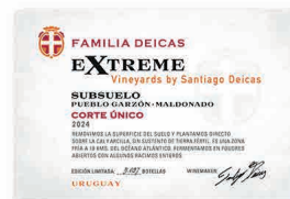
97 FAMILIA DEICAS Extreme Vineyard Subsuelo Corte Único 2024 Tannat, Merlot MALDONADO