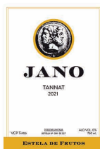
95 ESTELA DE FRUTOS Jano 2021 Tannat SAN JOSÉ