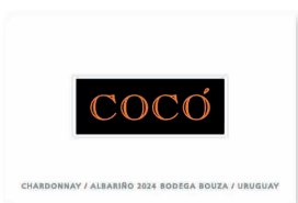
95 BOUZA Cocó 2024 Chardonnay, Albariño URUGUAY