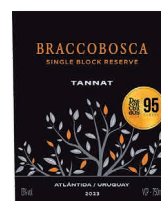
95 BRACCOBOSCA Single Block Reserve 2023 Tannat ATLÁNTIDA