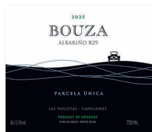
96 BOUZA Parcela Única B29 2025 Albariño LAS VIOLETAS