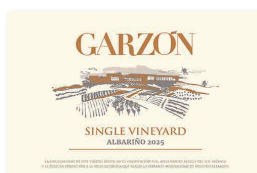
95 GARZÓN Single Vineyard 2025 Albariño GARZÓN