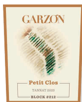
98 GARZÓN Petit Clos Block 212 2023 Tannat GARZÓN