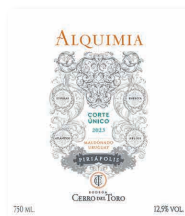
95 CERRO DEL TORO Alquimia Corte Único Blanco 2023 Chardonnay, Albariño, Viognier MALDONADO