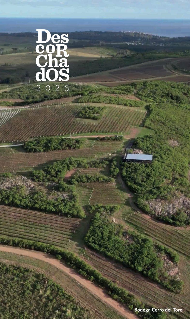
Bodega Cerro del Toro