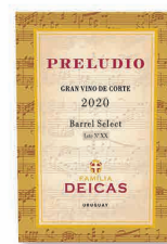
96 FAMILIA DEICAS Preludio Barrel Select Tinto 2020 URUGUAY