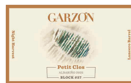
95 GARZÓN Petit Clos Block 27 2025 Albariño GARZÓN