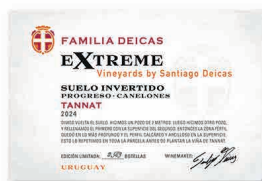
97 FAMILIA DEICAS Extreme Vineyard Suelo Invertido 2024 Tannat CANELONES