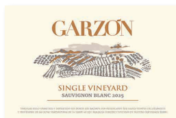
95 GARZÓN Single Vineyard 2025 Sauvignon Blanc GARZÓN