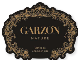
95 GARZÓN Sparkling Nature 2024 Chardonnay, Pinot Noir GARZÓN