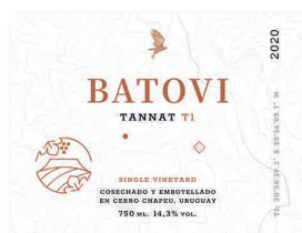
96 CERRO CHAPEU Batovi T1 2021 Tannat RIVERA