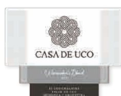
98 CASA DE UCO Casa de Uco Winemaker's Blend 2021 Malbec, C. Franc, Petit Verdot CHACAYES