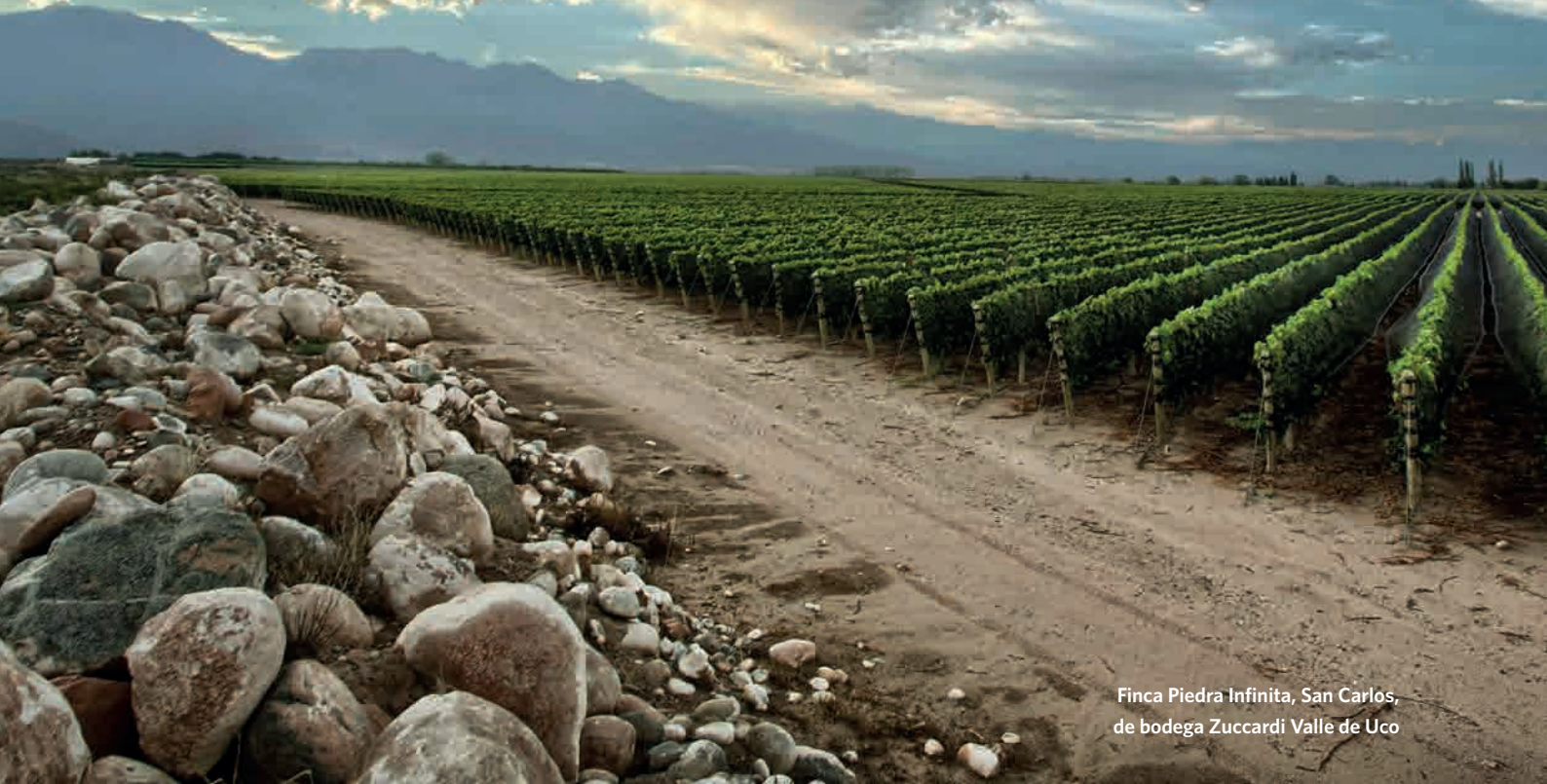
Finca Piedra Infinita, San Carlos, de bodega Zuccardi Valle de Uco