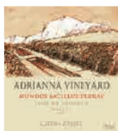
100 CATENA ZAPATA Adrianna Vineyard Mundus Bacillus Terrae 2023 Malbec MENDOZA