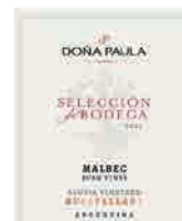
98 DOÑA PAULA Selección de Bodega 2022 Malbec GUALTALLARY