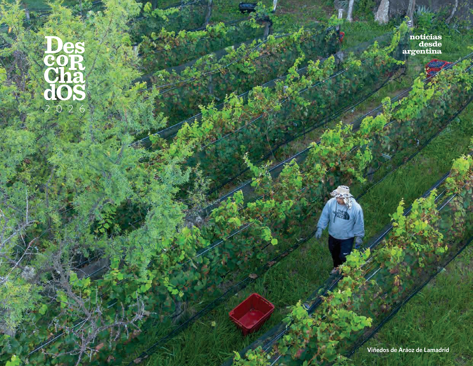
Viñedos de Aráoz de Lamadrid

todos imprescindibles si se le quiere tomar el pulso a la zona, promediaron los 12,2 grados de alcohol.