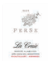
98 PERSE La Craie 2023 Malbec, Cabernet Franc GUALTALLARY