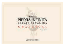
100 ZUCCARDI VALLE DE UCO Finca Piedra Infinita Gravascal 2023 Malbec ALTAMIRA