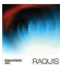
98 RAQUIS Monasterio 2023 Malbec GUALTALLARY