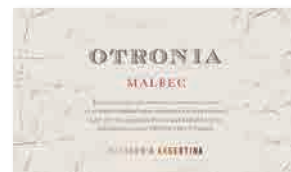
98 OTRONIA Otronia 2022 Malbec PATAGONIA ARGENTINA