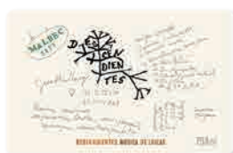
98 FAMILIA MILLÁN Descendientes Música de Loicas 2023 Malbec GUALTALLARY