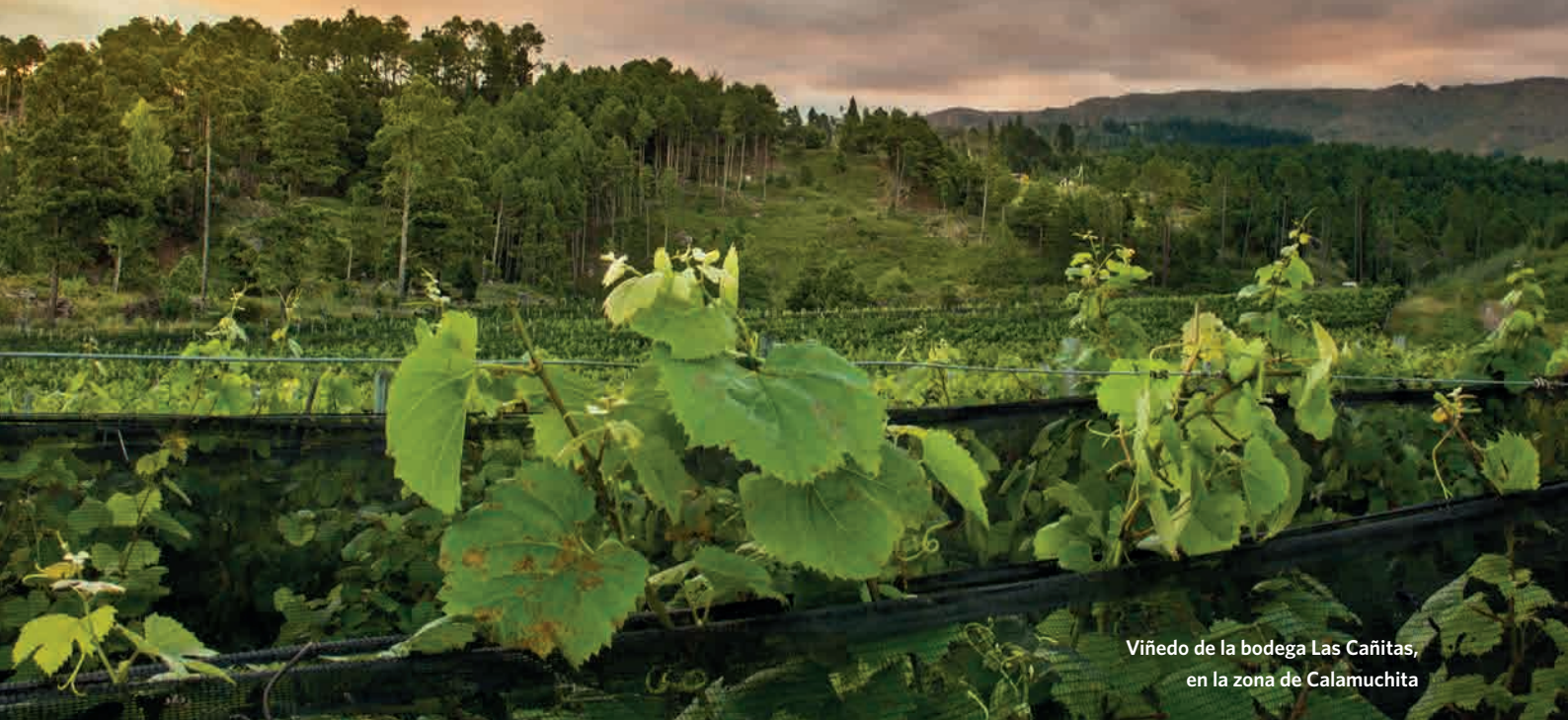
Viñedo de la bodega Las Cañitas, en la zona de Calamuchita