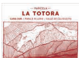
98 CARA SUR Parcela La Tatora 2024 Criolla Chica SAN JUAN