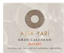
99 ALTA YARI Alta Yari Gran Malbec Calcáreo 2024 Malbec GUALTALLARY